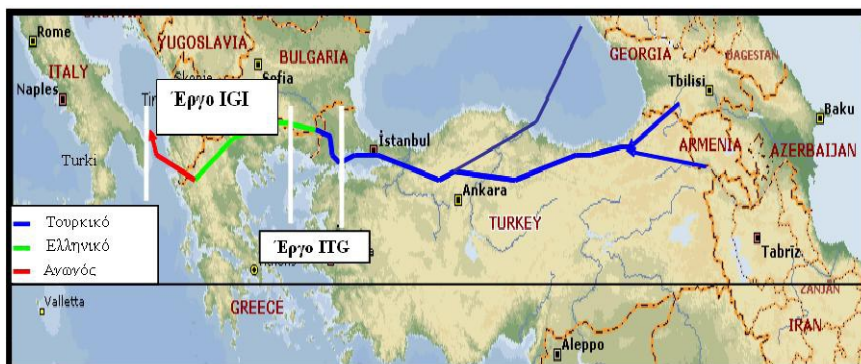
Tableau 3- Le projet de gazoduc sous-marin TGI - Interconnector 11

La revalorisation de la position géopolitique de la Grèce, perspectives et opportunités en lien avec le transport de l'énergie et le projet de l'Union pour la Méditerranée